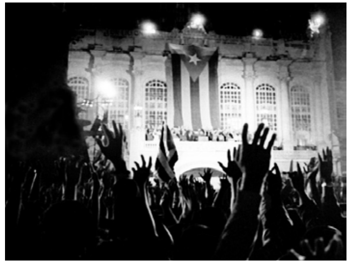
Creación de los CDR: Antiguo Palacio Presidencial, 28 de Septiembre de 1960.

Entre sus actividades se cuentan el mantenimiento de edificios, la limpieza de calles, la separación de los residuos para su reciclaje, la activación de mecanismos para el ahorro energético, el patrullaje nocturno de vigilancia, etc. Otras tareas incluyen la entrega de sangre para los hospitales, la lucha y vigilancia contra posibles infiltraciones de paquetes de drogas por los mares que rodean la isla de Cuba, la incorporación de los jóvenes al estudio y el trabajo, y la atención a familias con desventajas sociales o ancianos desamparados. También tuvieron como objetivos,