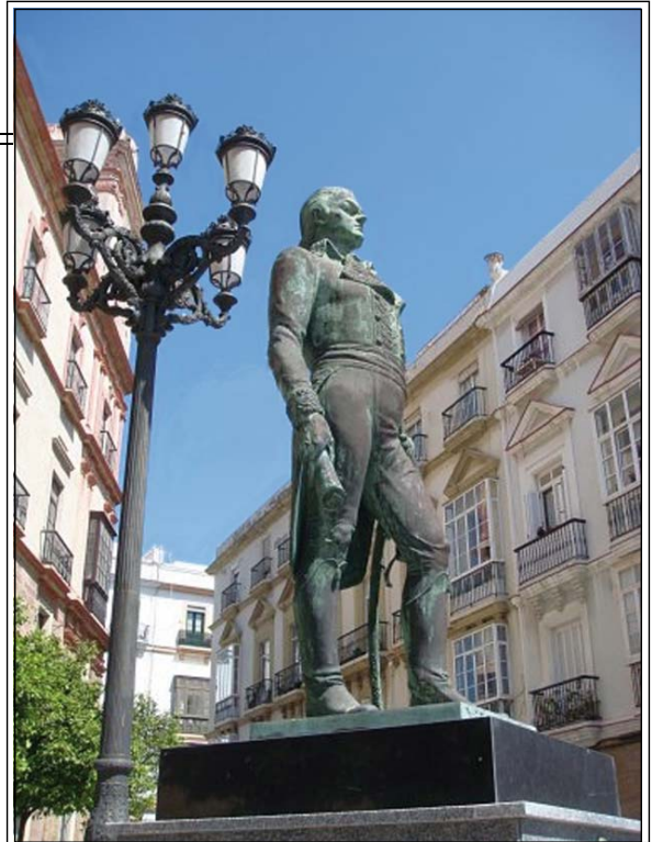
Homenaje de Cádiz al venezolano Francisco de Miranda, «El Precursor de la Emancipación Americana». Este sí, un hombre de libertad.

No es lícito utilizar el premio gaditano como arma arrojada contra un gobierno democrático, en aras a colaborar con la perversa campaña mediática que, Estados Unidos, tiene orquestada contra todos los países progresistas latinoamericanos, y el gobierno español, en particular, contra Venezuela. Así como marchitar el